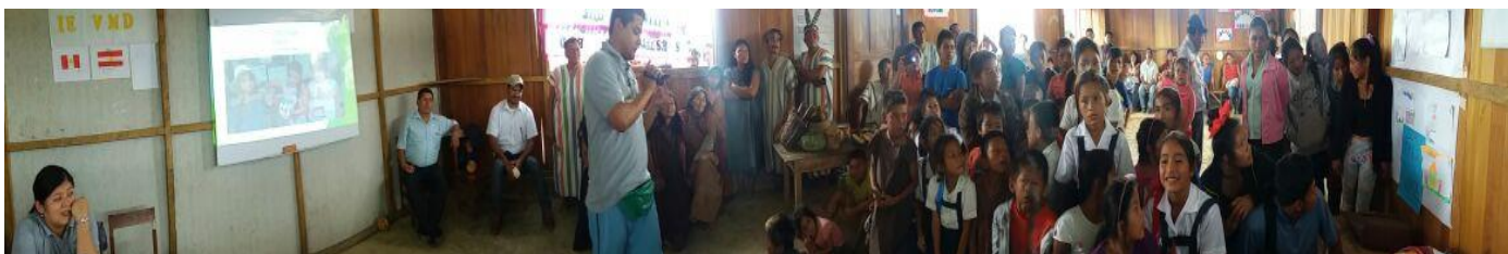
Die Kinder aus Puerto Lagarto bei der Spendenübergabe