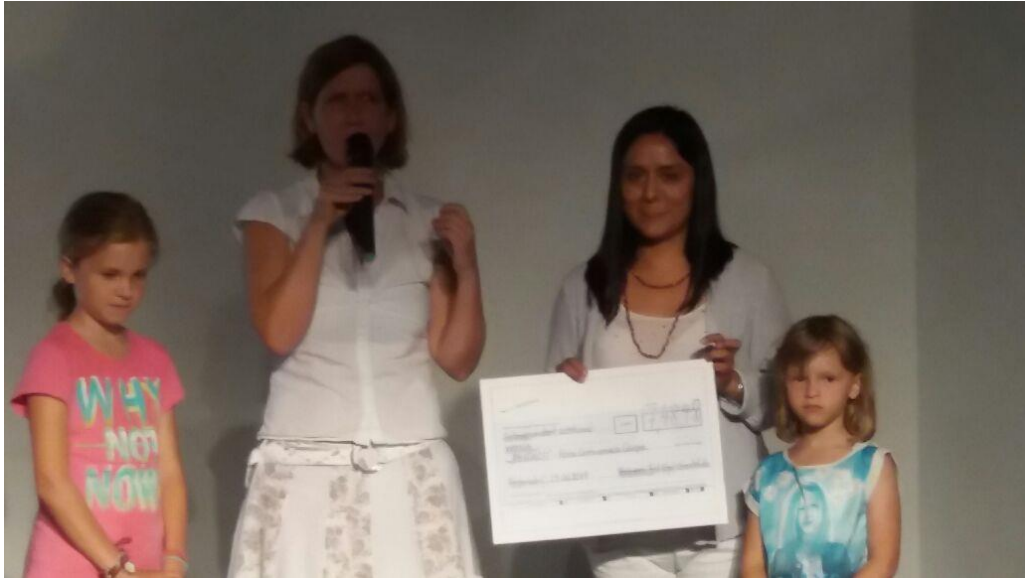
Die Spendenübergabe in der Scheune der Fred-Vogel-Grundschule