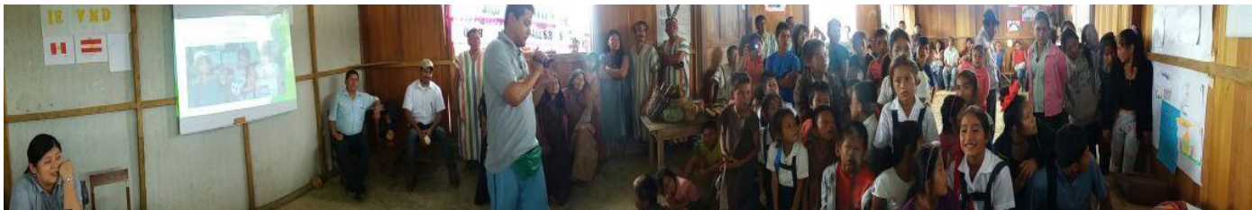
Die Kinder aus Puerto Lagarto bei der Spendenübergabe