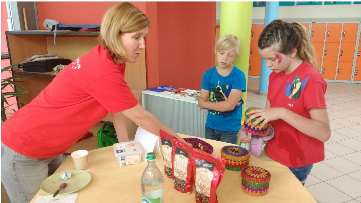
Renaco-Peru-Stand auf dem Fred-Vogel-Fest